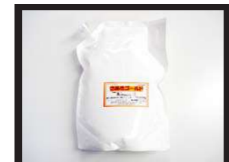
1袋 2.5kg 入 1ケース 8個入