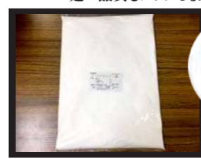
1袋 2kg 入