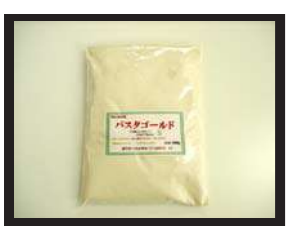
1袋 500g 入