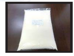
1袋 1kg 入