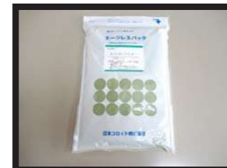
乾燥わかめ 風味・色彩・味抜群！ 各1kg入