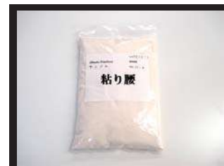
1袋 1kg 入