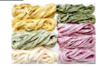
硬さ・粘りと最高の食感を実現！