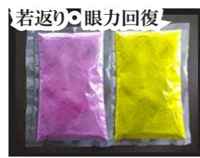
ムラサキ芋粉・ウコン粉