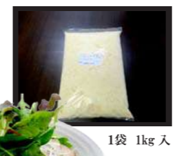
1袋 1kg 入