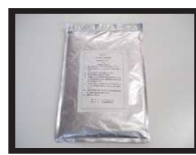
1袋 1kg 入