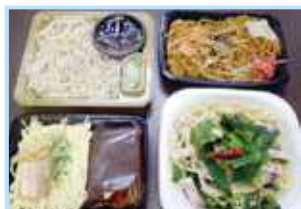
コンビニ調理麺 冷やし中華・ザル蕎麦・焼きそば