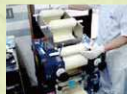
ラーメン製造 (複合)