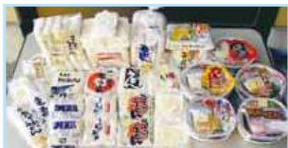
チルド麺・冷凍麺・生麺・調理麺 生ラーメン・茹でうどん・冷凍讃岐うどん