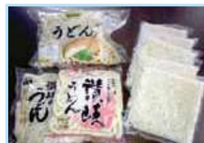
L麺・LL麺 讃岐うどん・ラーメン