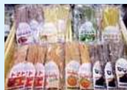
各種・地産地消麺