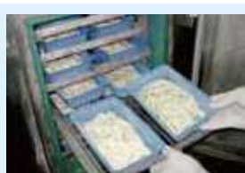
冷凍麺(急速フリーザー)