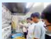
讃岐うどん学校(ダシ・麺)