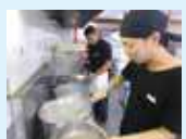
ラーメン学校(スープ・麺)