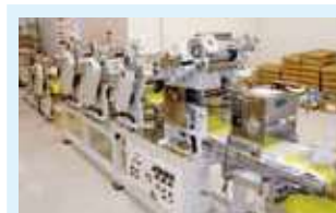
4段ロール麺機(スリッター)