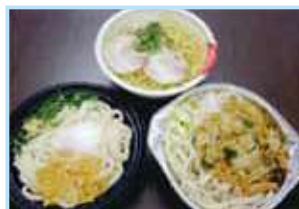
コンビニ調理麺(レンジ用) 讃岐うどん・ラーメン