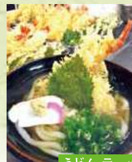
うどん・ラーメン・パスタ