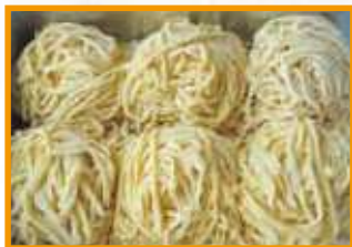
多加水手揉みラーメン