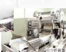
麺線二つ折り装置