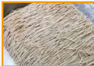
十割蕎麦(包丁切り)