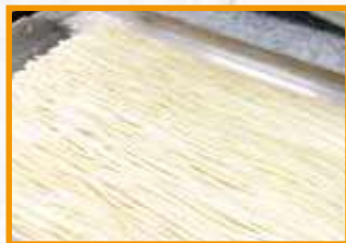
讃岐うどん(包丁切り)