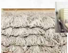
自動せいの(箱)盛り「20~40食/箱」