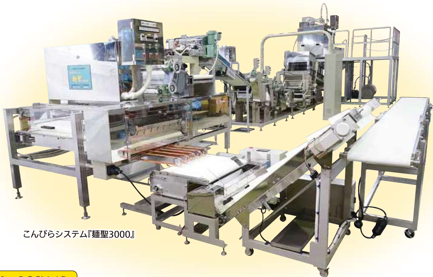
こんぴらシステム『麺聖3000』