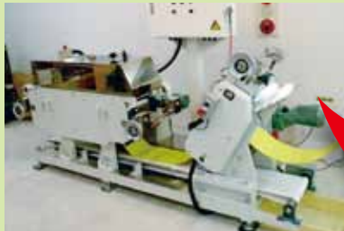
品質を無視! 単なる成形機