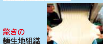
驚きの 麺生地組織