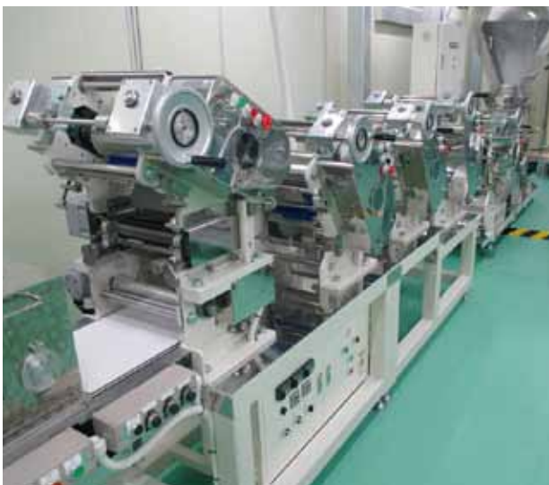
《少加水用製麺設備》