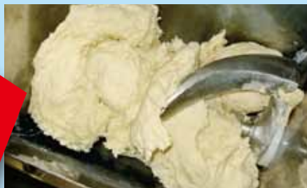
グルテンを100%引出し強靱な組織に! 何と!ネリ上がりでこの粘り!