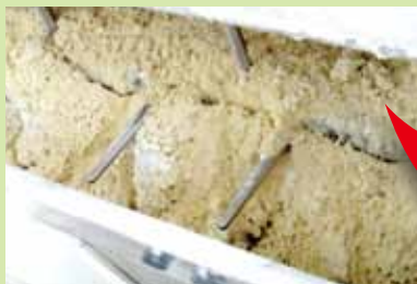
グルテン組織弱く、ネリに欠陥!